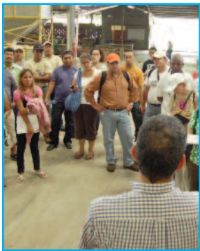
Visiting a local sawmill

Tanto en países desarrollados como en los países en vía de desarrollo los pueblos que dependen de los bosques están preocupados por los mecanismos financieros emergentes relacionados con las inversiones forestales, los potenciales impactos negativos que las inversiones externas pueden tener en sus modos de subsistencia y las pocas oportunidades que existen para que las poblaciones locales accedan a aquellas inversiones que cumplen con sus prioridades. Existen diferentes percepciones (y quizás también conceptos erróneos) entre las partes interesadas en la ILCF y generalmente hay una falta de comprensión mutua de la forestería a pequeña escala o comunitaria por parte de la comunidad de inversores y de la inversión por parte de aquellos que practican la forestería a pequeña escala o de forma comunitaria. Sin embargo, existe el reconocimiento compartido de la importancia de invertir en el manejo localmente controlado de bosques para crear economías resilientes (con capacidad de recuperación) que puedan sustentarse y generar retornos de los recursos forestales—y se ha expresado ampliamente el interés por aprender más sobre cómo lograrlo.